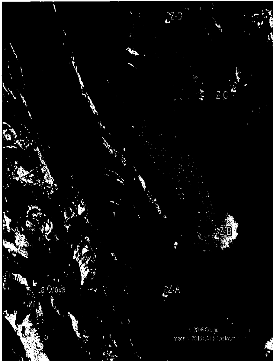
Figura 2: Área estudio del proyecto Margen Izquierdo