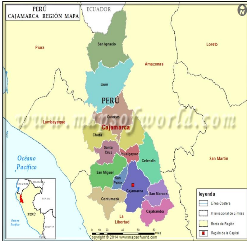
Figura N° 01. Mapa de ubicación del proyecto

Código: O1.4.PL5 Versión: 01 Fecha: 08-05-2023