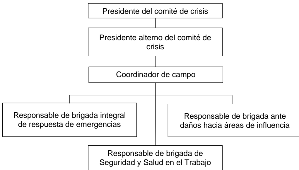
Figura 2. Organigrama del Comité de Crisis