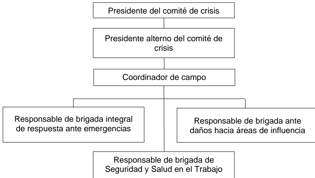
Figura 1. Organigrama del Comité de Crisis