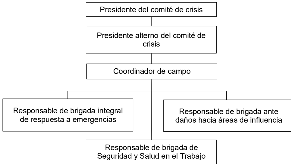
Figura 3. Organigrama del Comité de Crisis